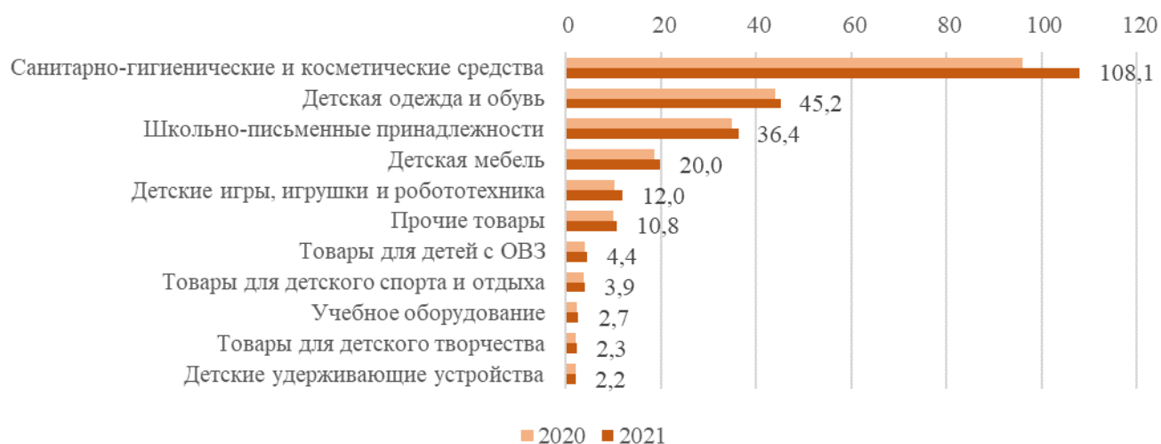
Прогноз производства товаров для детей в 2021 г., млрд руб.

Объем рынка товаров для детей в 2020 году составил 832 млрд рублей (2019 г. – 843 млрд рублей), при этом на 1 600 российских производителей пришлось 228 млрд рублей.